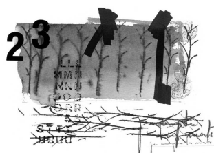
Chien chez Goater